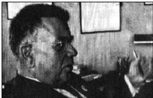
Dr. Edward U. Condon, kendt kvantefysiker skulle give University of Colorado berømmelse.