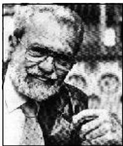
J. Allen Hynek dannede i 1973 sammen med andre videnskabsmænd CUFOS.