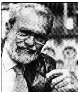
J. Allen Hynek dannede i 1973 sammen med andre videnskabsmænd CUFOS.