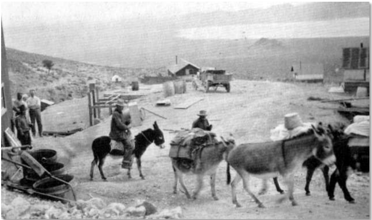
Minebyen Groom Mine fotografert i 1917. I baggrunden skimtes Groom Lake.