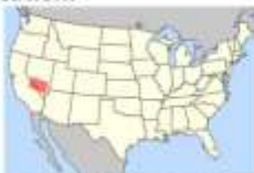
Location of main map