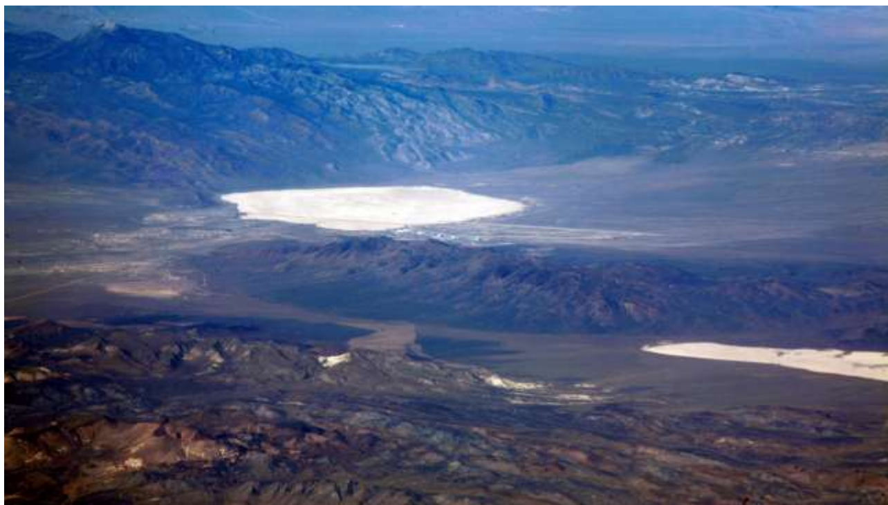
Øverst ses Area 51 og Groom Lake. Nederst til højre skimtes den øde Papoose Lake.

Der findes mange andre Area's, bl.a. Area 52, som er det landområde, hvor Tonopah Test Range ligger. Her havde F-117A stealth-flyene hjemme i begyndelsen af 1980'erne.